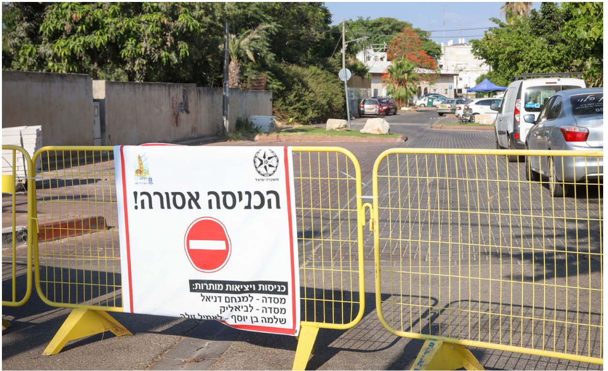
בעקבות הטלת הסגרים, נרשמה ירידה חדה במספר החולים.

למרחב הציבורי באזור המוגבל, תותר יציאה ממקום המגורים אך ורק למטרות שפורטו בסעיף 16 ל"חוק סמכויות מיוחדות להתמודדות עם נגיף הקורונה". הוועדה רשאית לקבוע מטרות נוספות שמותרות יציאה מהבית. כדי למנוע ספק, באזור עליו מוטלות הגבלות, מפיץ משרד הבריאות חוברת המפרטת את הנסיבות בהן מותר לצאת מהבית. אם הוטל סגר באזורכם ואתם מסתפקים אם מותר לצאת, תוכלו לבדוק זאת במוקד קול הבריאות *5400.