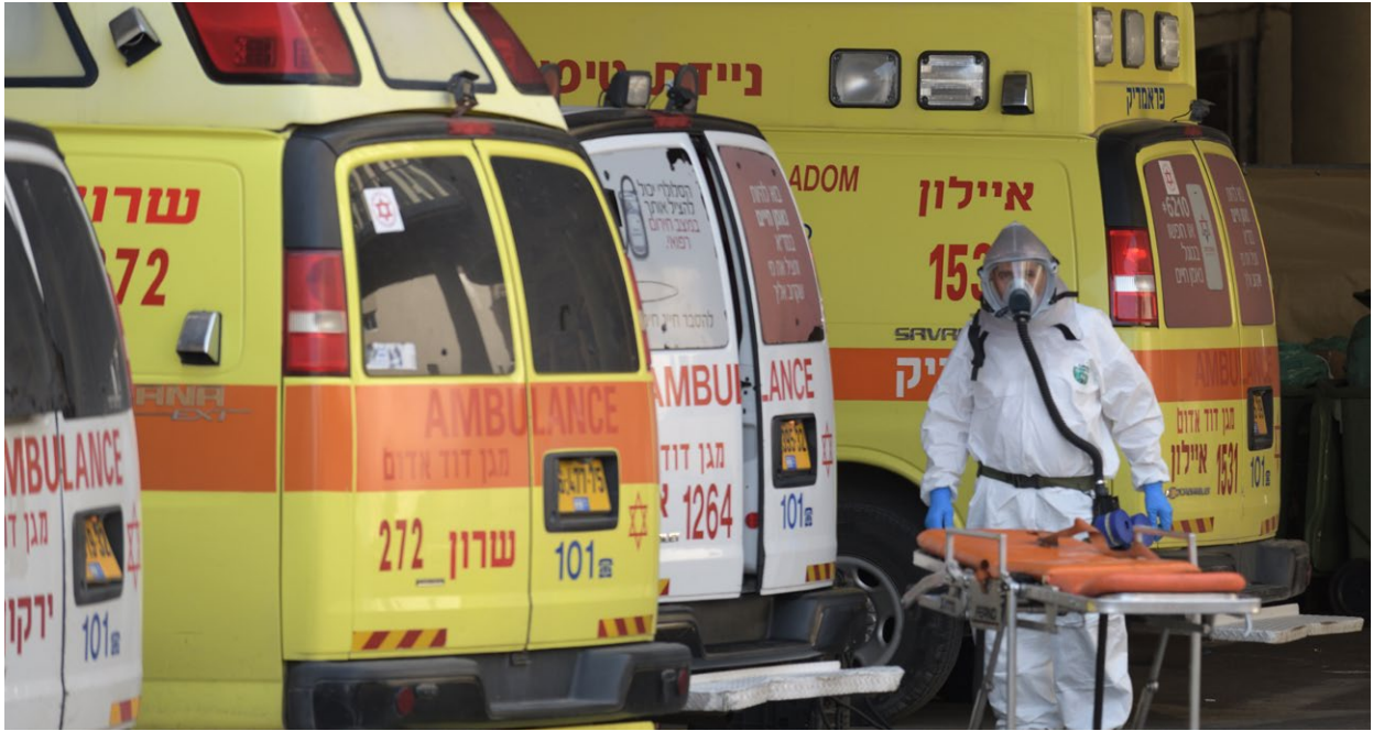
כוחות ההצלה בפניו נדבקים לבתי החולים.