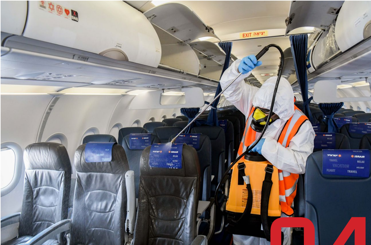
חיטוי מטוסים לאחר נחיתה.