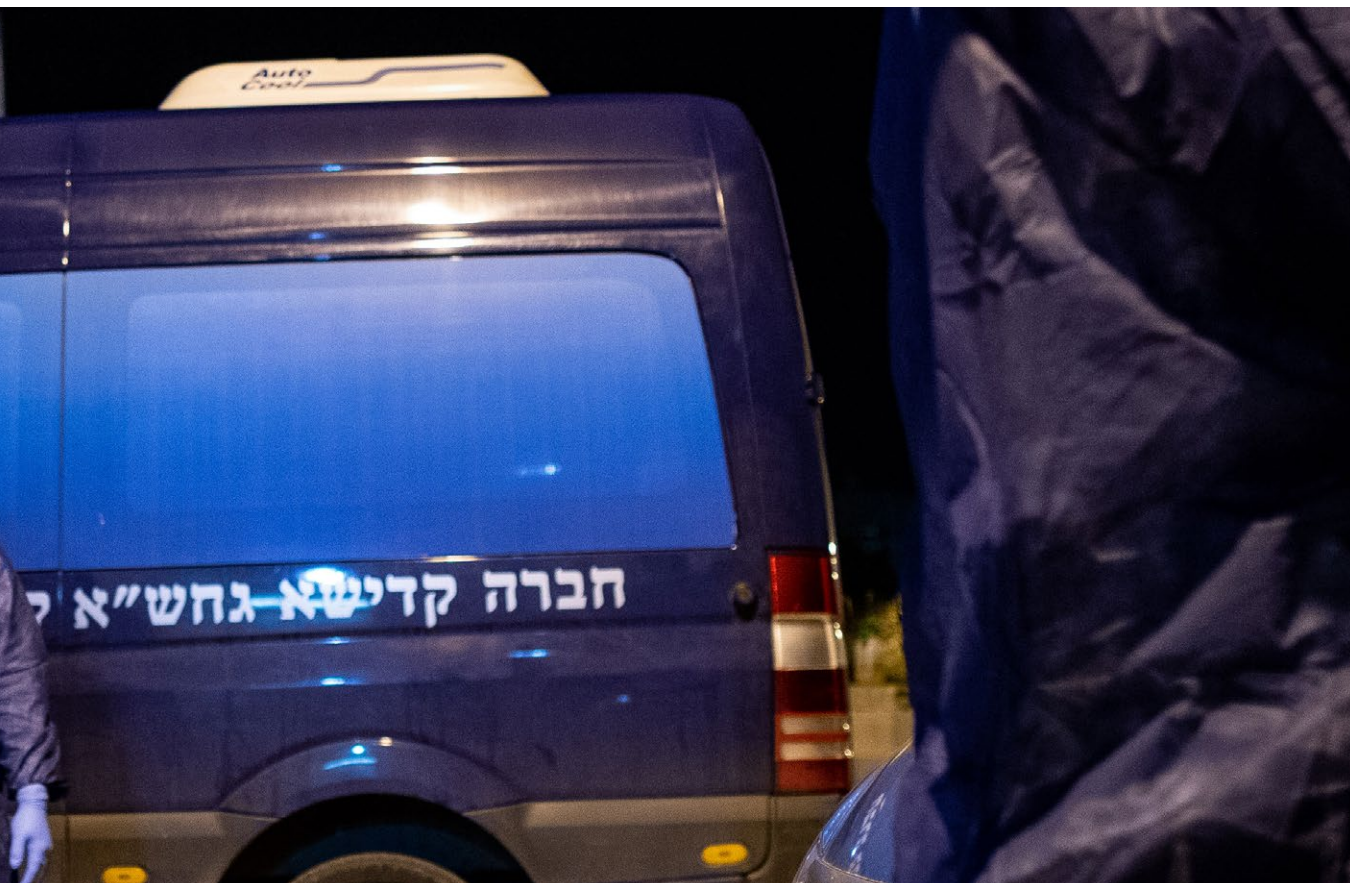
בגל ראשון אנשים שהיו חייבים בבידוד והגיעו לשמוע "זכור" ולקריאת מגילה גרמו ל"ע לחולים ונפטרים.

המלון לא מספק טיטולים. יש בית כנסת וספר תורה, את התפילות ושיעורי התורה מארגנים החולים בעצמם.