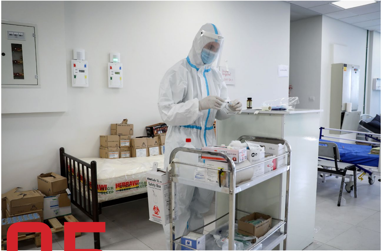
חלוקת ציוד וביצוע בדיקת לחולים.