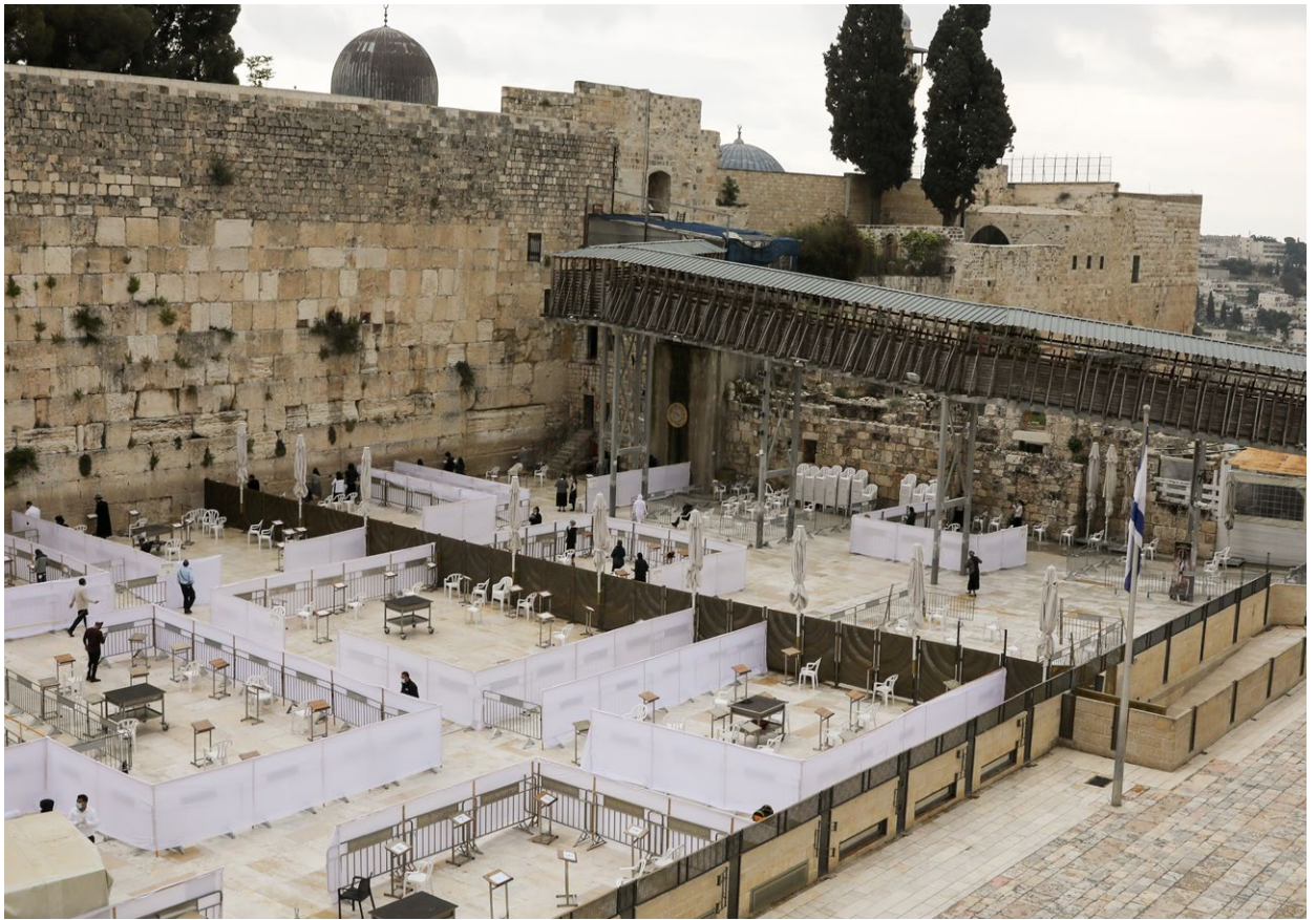
רחבת הכותל המערבי מחולקת לאיזורי תפילה.

2. האם יש הבדל מבחינת הסיכון הבריאותי, בין צום בתקופה רגילה לבין צום בזמן מגיפת הקורונה? לא.